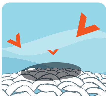
Enzym působí na skvrny

Vysoce účinné složky, které skvěle odstraňují skvrny a čistí i nejdolnější profesní skvrny.