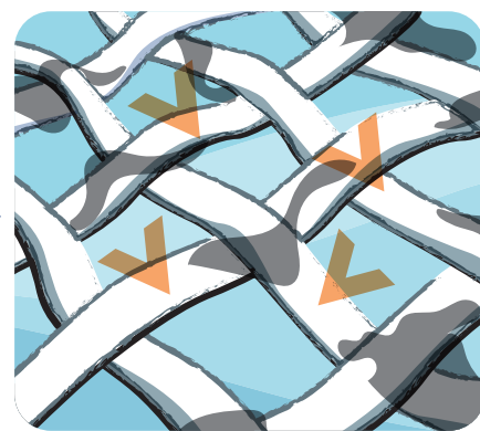
Další složky odstraní rozloženou skvrnu snadněji